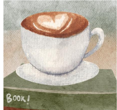
Læsefællesskab i Trige