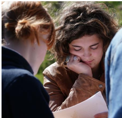
LYT OG HYG